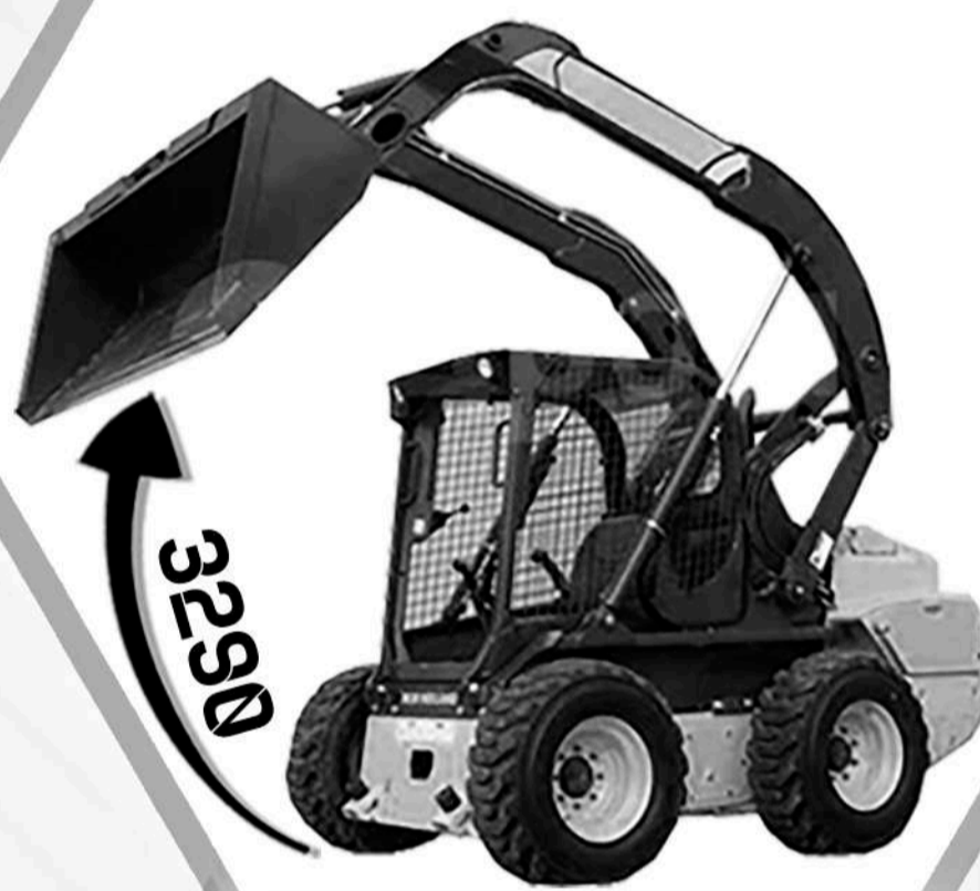
NEW HOLLAND L325